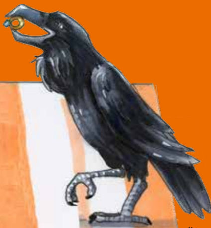
Illustration: Helene Schoof

Kosten: € 2,- (Kinder bis 18 Jahre) | € 8,- (Erwachsene) Die Teilnehmerzahl ist begrenzt. Anmeldung unter Tel.: 030.254 81-178 oder kasse@mimpk.de Altersempfehlung: 6 bis 10 Jahre